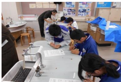
2年生 高校出前授業体験